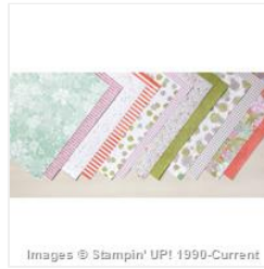
Succulent Garden Designer Series Paper - 147363 Price: $0.00