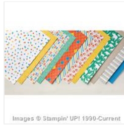
Party Animal Designer Series Paper - 147365 Price: $0.00