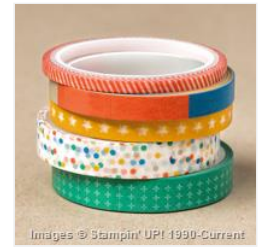
Party Animal Designer Washi Tape - 147362 Price: $0.00