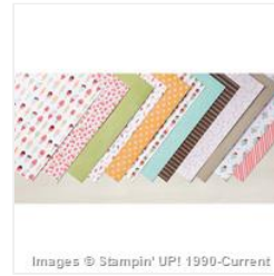
Tasty Treats Specialty Designer Series Paper - 147364 Price: $0.00