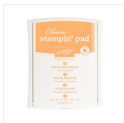
Peekaboo Peach Classic Stampin' Pad - 141398 Price: $6.50