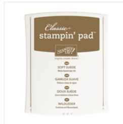
Soft Suede Classic Stampin' Pad - 126978