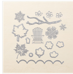
Seasonal Layers Dies - 143751