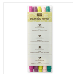
2017-2019 In Color Stampin' Write Markers - 144033