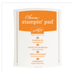
Pumpkin Pie Classic Stampin' Pad - 126945 Price: $6.50