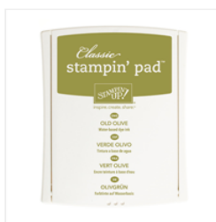
Old Olive Classic Stampin' Pad - 126953 Price: $6.50