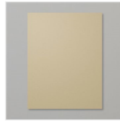
Crumb Cake 8-1/2" X 11" Cardstock - 120953