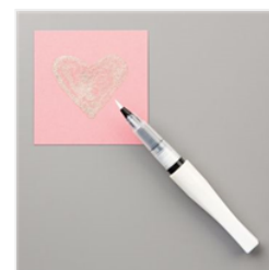
Wink Of Stella Clear Glitter Brush - 141897 Price: $10.00