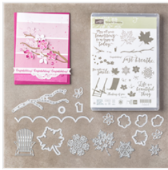
Colorful Seasons Photopolymer Bundle - 145348