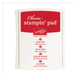
Real Red Classic Stampin' Pad - 126949 Price: $6.50