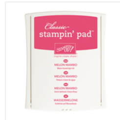
Melon Mambo Classic Stampin' Pad - 126948