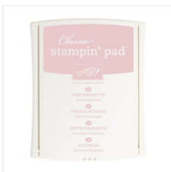
Pink Pirouette Classic Stampin' Pad - 126956