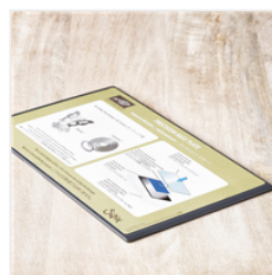
Precision Base Plate - 139684 Price: $25.00