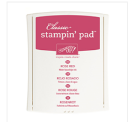
Rose Red Classic Stampin' Pad - 126954