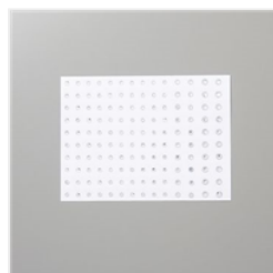
Rhinstone Basic Jewels - 144220