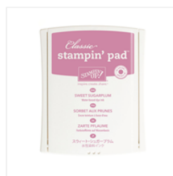
Sweet Sugarplum Classic Stampin' Pad - 141395 Price: $6.50