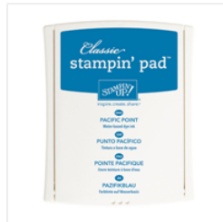
Pacific Point Classic Stampin' Pad - 126951