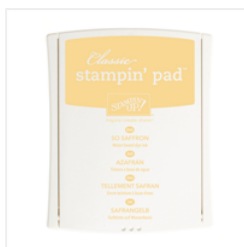
So Saffron Classic Stampin' Pad - 126957 Price: $6.50