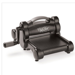
Big Shot - 143263 Price: $110.00