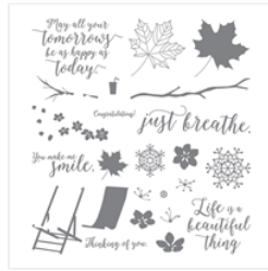
Colorful Seasons Stamp Set - 143726