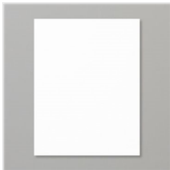
Whisper White 8- 1/2" X 11" Cardstock - 100730