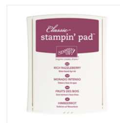
Rich Razzleberry Classic Stampin' Pad - 126950 Price: $6.50