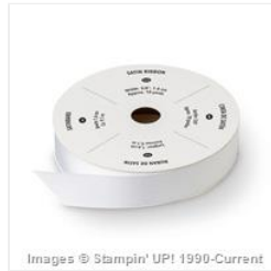
Whisper White 5/8" Satin Ribbon - 134549