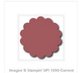
7/8" Scallop Circle Punch - 129404 Price: $21.00