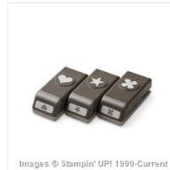
Itty Bitty Accents Punch Pack - 133787 Price: $30.00