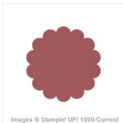
1-1/4" Circle Scallop Punch - 127811 Price: $28.00