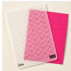
Happy Heart Textured Impressions Embossing Folder - 137364 Price: $13.00