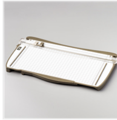
Stampin' Trimmer - 129722