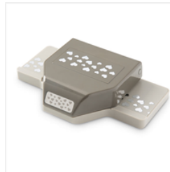
Confetti Hearts Border Punch - 137415 Price: $37.00