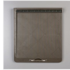
Simply Scored Scoring Tool - 122334