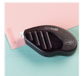
Fast Fuse Adhesive - 129026 Price: $13.00