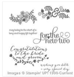
For The New Two Clear-Mount Stamp Set - 138562 Price: $31.00