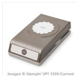
1-3/4" Scallop Circle Punch - 119854 Price: $31.00