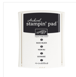
Basic Black Archival Stampin' Pad - 140931 Price: $12.25