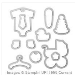
Baby's First Framelits Dies - 133735