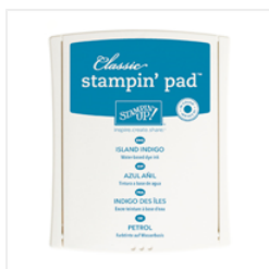
Island Indigo Classic Stampin' Pad - 126986