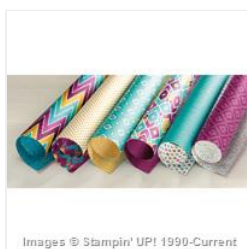
Bohemian Designer Series Paper - 138446