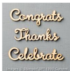
Expressions Natural Elements - 138395