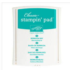
Bermuda Bay Classic Stampin' Pad - 131171