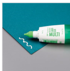
Multipurpose Liquid Glue - 110755