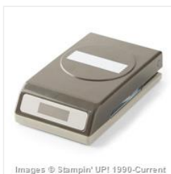
Washi Label Punch - 138296