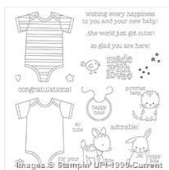
Made With Love Photopolymer Stamp Set - 138662