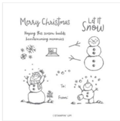
Snowman Season Photopolymer Stamp Set - 150458

justpeachystamping@gmail.com https://justpeachystamping.com