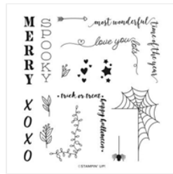
Festive Corners Photopolymer Stamp Set (English) - 153462