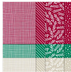
Classic Christmas 6" X 6" (15.2 X 15.2 Cm) Designer Series Paper - 155969