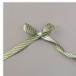
Mossy Meadow 3/8" (1 Cm) Diagonal Stripe Ribbon - 153542