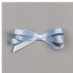
Seaside Spray 1/4" (6.4 Mm) Metallic Ribbon - 150446