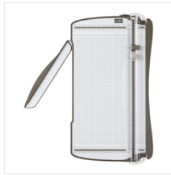
Stampin' Trimmer - 126889