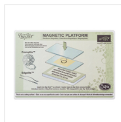
Magnetic Platform - 130658