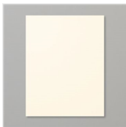
Very Vanilla 8-1/2" X 11" Cardstock - 101650