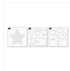
Eclectic Paper- Piercing Pack - 133778