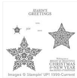
Bright & Beautiful Clear-Mount Stamp Set - 135029