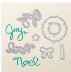
Wonderful Wreath Framelits Dies - 135851