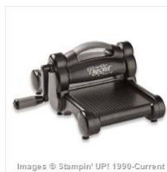
Big Shot - 113439