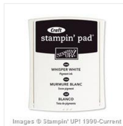
Whisper White Craft Stampin' Pad - 101731