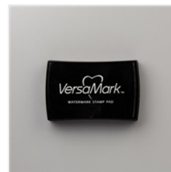
Versamark Pad - 102283