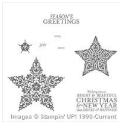
Bright & Beautiful Wood-Mount Stamp Set - 135026

stampwithmarybush@yahoo.com www.stampinthesand.stampinup.net