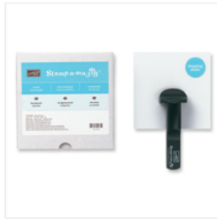
Stamp-A-Ma-Jig - 101049