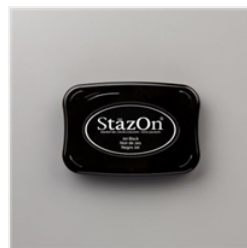
Jet Black Stazon Pad - 101406