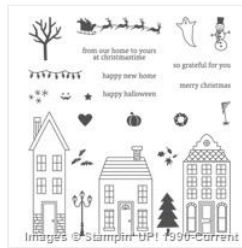
Holiday Home Photopolymer Stamp Set - 135095