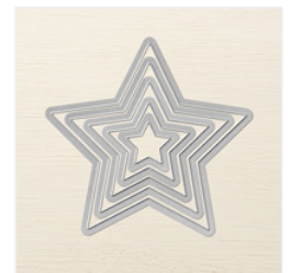
Stars Framelits Dies - 133723