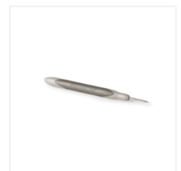
Paper-Piercing Tool - 126189