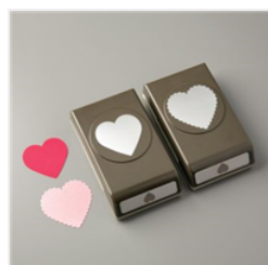
Heart Punch Pack - 151292