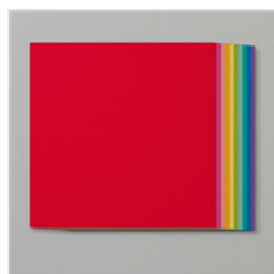
Brights 12" X 12" (30.5 X 30.5 Cm) Cardstock - 147001