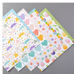
Pleasant As Punch Designer Series Paper - 153558