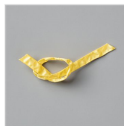
Daffodil Delight 1/4" (6.4 Mm) Ruched Ribbon - 151311