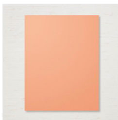
Grapefruit Grove 8-1/2" X 11" Cardstock - 146972