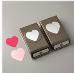
Heart Punch Pack - 151292