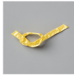
Daffodil Delight 1/4" (6.4 Mm) Ruched Ribbon - 151311