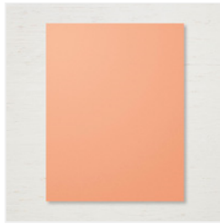
Grapefruit Grove 8-1/2" X 11" Cardstock - 146972