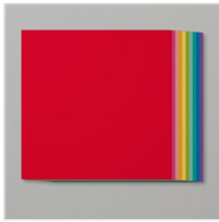
Brights 12" X 12" (30.5 X 30.5 Cm) Cardstock - 147001