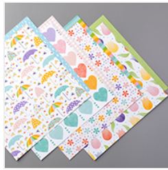
Pleased As Punch Designer Series Paper - 153558