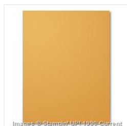
Delightful Dijon 8- 1/2" X 11" Cardstock - 138338