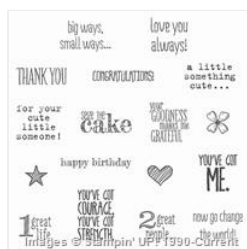
Something To Say Wood-Mount Stamp Set - 134177