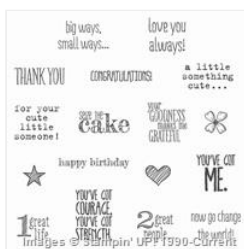
Something To Say Clear-Mount Stamp Set - 134180