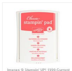
Watermelon Wonder Classic Stampin' Pad - 138323