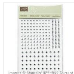
Rhinestone Basic Jewels - 119246