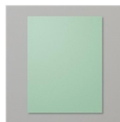
Mint Macaron 8- 1/2" X 11" Cardstock - 138337