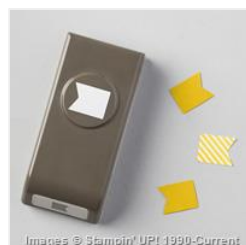
Banner Punch - 133519