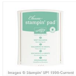
Mint Macaron Classic Stampin' Pad - 138326