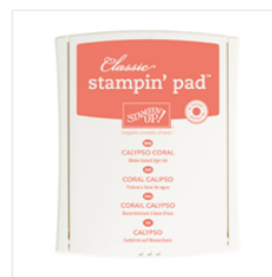
Calyпсо Coral Classic Stampin' Pad - 126983