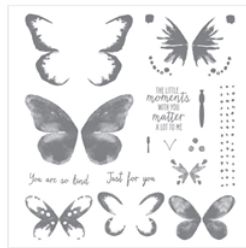
Watercolor Wings Photopolymer Stamp Set - 139424