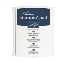
Night Of Navy Classic Stampin' Pad - 126970