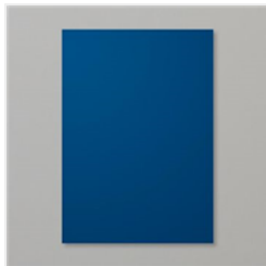
Night Of Navy A4 Cardstock - 106577