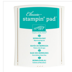
Bermuda Bay Classic Stampin' Pad - 131171