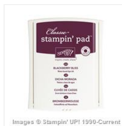
Blackberry Bliss Classic Stampin' Pad - 133642