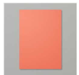
Calyпсо Coral A4 Cardstock - 124392