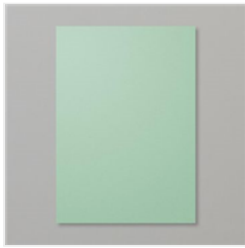
Mint Macaron A4 Cardstock - 138344

http://www.stampinup.com/ECWeb/default.aspx&dbwsdemoid=4010076