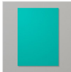
Bermuda Bay A4 Cardstock - 131286