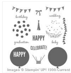
Celebrate Today Photopolymer Stamp Set - 137138