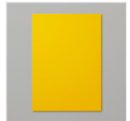
Crushed Curry A4 Cardstock - 131288