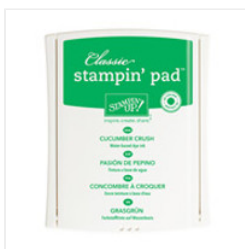
Cucumber Crush Classic Stampin' Pad - 138324