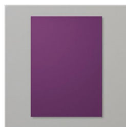
Blackberry Bliss A4 Cardstock - 133682