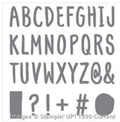
Layered Letters Alphabet Photopolymer Stamp - 138692

http://www.stampinup.com/ECWeb/default.aspx&dbwsdemoid=4010076