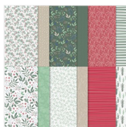
Tidings Of Christmas 6" X 6"