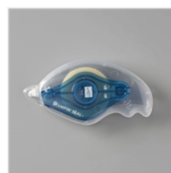
Stampin' Seal+ -