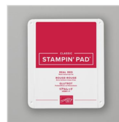
Real Red Classic