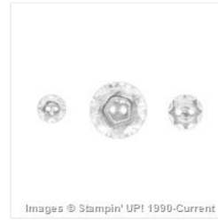
Vintage Faceted Designer Buttons - 127555 Price: $10.50