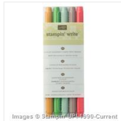
2015-2017 In Color Stampin' Write Markers - 138333 Price: $26.00