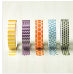
2014-2016 In Color Designer Washi Tape - 138382 Price: $14.00