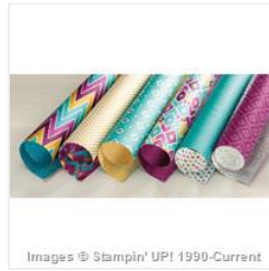
Bohemian Designer Series Paper - 138446 Price: $19.25