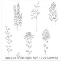
Flowering Fields Clear-Mount Stamp Set - 141303 Price: $0.00