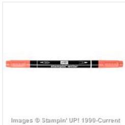
Calypso Coral Stampin' Write Marker - 131902 Price: $6.00