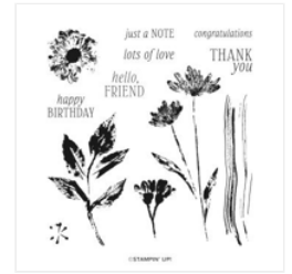
Inked & Tiled Cling Stamp Set (English) - 161158