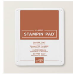
Copper Clay Classic Stampin' Pad - 161647