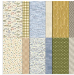
Let's Go Fishing 12" X 12" (30.5 X 30.5 Cm) Designer Series Paper - 161534