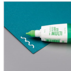
Multipurpose Liquid Glue - 110755