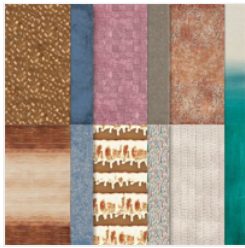
Earthen Elegance 12" X 12" (30.5 X 30.5 Cm) Designer Series Paper - 161503