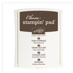
Early Espresso Classic Stampin' Pad - 126974