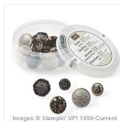
Antique Brads - 117273