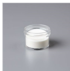
Clear Stampin' Emboss Powder - 109130