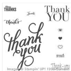
Another Thank You Photopolymer Stamp Set - 136835