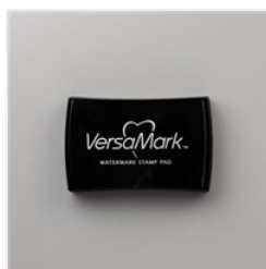
Versamark Pad - 102283