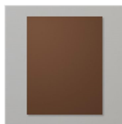
Early Espresso 8- 1/2" X 11" Cardstock - 119686