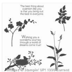
World Of Dreams Clear-Mount Stamp Set - 134186

astampingteddy@gmail.com http://stampingincolumbusga.blogspot.com/