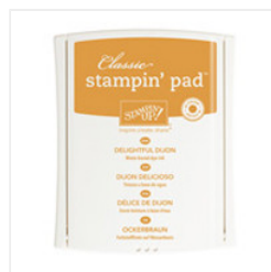
Delightful Dijon Classic Stampin' Pad - 138327