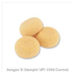
Stamping Sponges - 101610