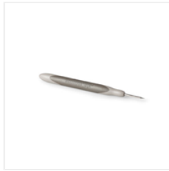
Paper-Piercing Tool - 126189