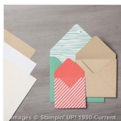
Neutrals Envelope Paper - 138310