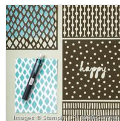
Happy Patterns Decorative Masks - 138313