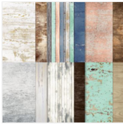
Country Woods 12" X 12" (30.5 X 30.5 Cm) Designer Series Paper - 163393

clarke.karen.a@gmail.com https://karenclarke.stampinup.net/