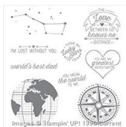
Going Global Clear-Mount Stamp Set - 140748