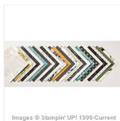
Going Places Designer Series Paper Stack - 140581