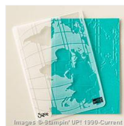
World Traveler Textured Impressions Embossing Folder - 138289