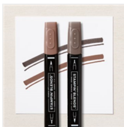
Duo De Marqueurs Stampin' Blends Ton Profond - 158152