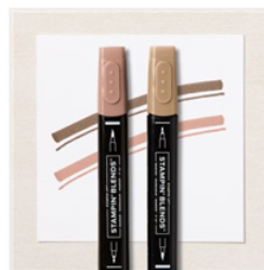
Duo De Marqueurs Stampin' Blends Ton Profond Moyen - 159461