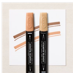
Duo De Marqueurs Stampin' Blends Ton Moyen - 159462