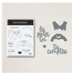
Lot Mieux Ensemble (Français) - 160264