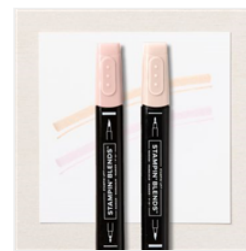
Duo De Marqueurs Stampin' Blends Ton Pâle - 159465