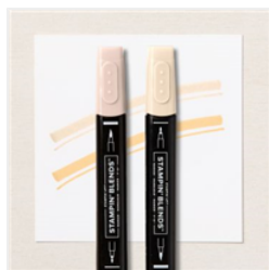
Duo De Marqueurs Stampin' Blends Ton Pâle Moyen - 159463