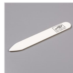
Ploir En Os - 102300