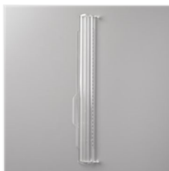
Règle Métrique Pour Coupe-Papier - 154980