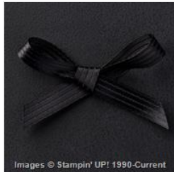
Basic Black 3/8" Stitched Satin Ribbon - 138430