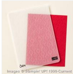
Elegant Dots Textured Impressions Embossing Folder - 138287