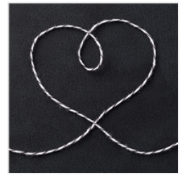
Basic Black Baker's Twine - 134576