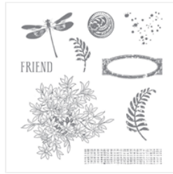
Awesomely Artistic Clear-Mount Stamp Set - 139950