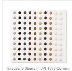
Neutrals Candy Dots - 130934