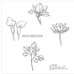
Remarkable You Clear-Mount Stamp Set - 139894