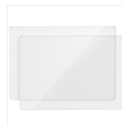
Standard Cutting Pads - 113475 Price: $11.00