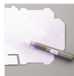
Stampin' Spritzer - 126185