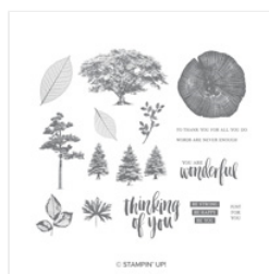
Rooted In Nature Clear-Mount Stamp Set - 146482