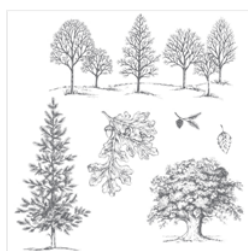
Lovely As A Tree Clear-Mount Stamp Set - 127793