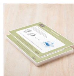
Big Shot Platform - 142802 Price: $26.00