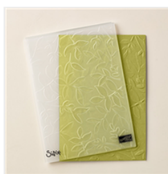
Layered Leaves Dynamic Textured Impressions Embossing Folder - 143704