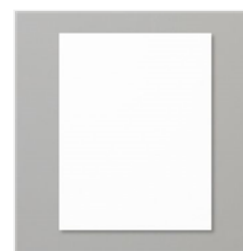
Whisper White 8- 1/2" X 11" Cardstock - 100730