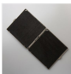
Stampin' Scrub - 126200