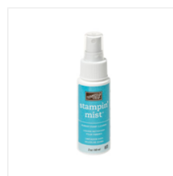
Stampin' Mist - 102394