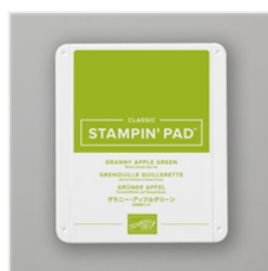
Granny Apple Green Classic Stampin' Pad - 147095