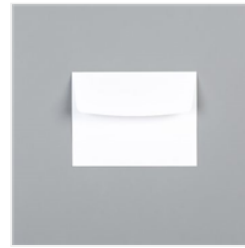
Umschläge C6 Flüsterweiss - 106588