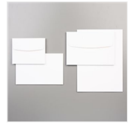
Gemischte Karten Und Umschläge Erinnerungen & Mehr - 149710