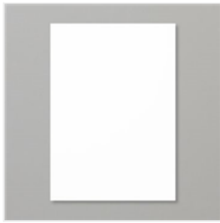
Farbkarton A4 Flüsterweiss - 106549