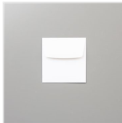
Umschläge 3" X 3" (7.6 X 7.6 Cm) In Flüsterweiss - 145829