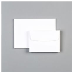
Grusskärtchen & Umschläge In Flüsterweiss - 131527