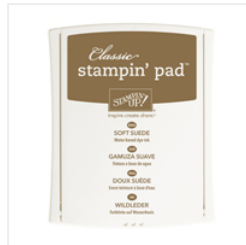
Soft Suede Classic Stampin' Pad - 126978 Price: $6.50