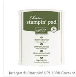
Mossy Meadow Classic Stampin' Pad - 133645 Price: $6.50