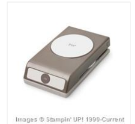
2-1/2" Circle Punch - 120906 Price: $18.00