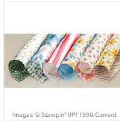
English Garden Designer Series Paper - 138440 Price: $11.00