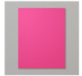
Melon Mambo 8- 1/2" X 11" Cardstock - 115320 Price: $14.00