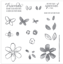
Garden In Bloom Photopolymer Stamp Set - 139433 Price: $25.00

stampswellwithothers@gmail.com http://donnas-stampswellwithothers.blogspot.com/