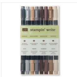
Neutrals Stampin' Write Markers - 131261 Price: $23.00