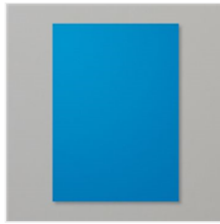
Pacific Point A4 Cardstock - 116202 Price: £8.75