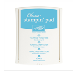
Tempting Turquoise Classic Stampin' Pad - 126952 Price: £6.00