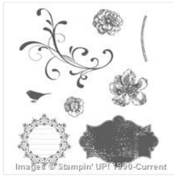
Everything Eleanor Clear-Mount Stamp Set - 124164 Price: £26.00