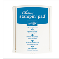
Pacific Point Classic Stampin' Pad - 126951 Price: £6.00