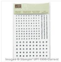
Rhinestone Basic Jewels - 119246 Price: £4.50