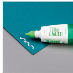
Multipurpose Liquid Glue - 110755 Price: £3.75