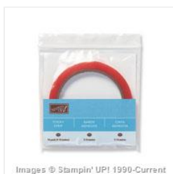
Sticky Strip - 104294