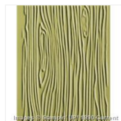
Woodgrain Textured Impressions Embossing Folder - 127821