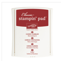
Cherry Cobbler Classic Stampin' Pad - 126966