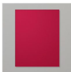
Cherry Cobbler 8-1/2\" X 11\" Cardstock - 119685