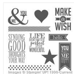
Perfect Pennants Clear-Mount Stamp Set - 133230