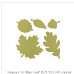
Autumn Accents Bigz Die - 127812