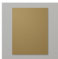
Soft Suede 8-1/2\" X 11\" Cardstock - 115318

suitabl stamped@gmail.com http://suitabl stamped.stampinup.net