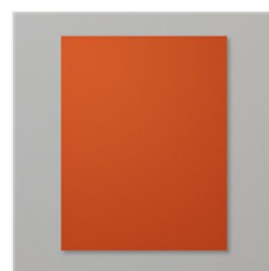
Cajun Craze 8-1/2\" X 11\" Cardstock - 119684