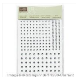
Rhinestone Basic Jewels - 119246