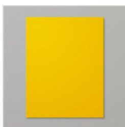
Crushed Curry 8-1/2\" X 11\" Cardstock - 131199