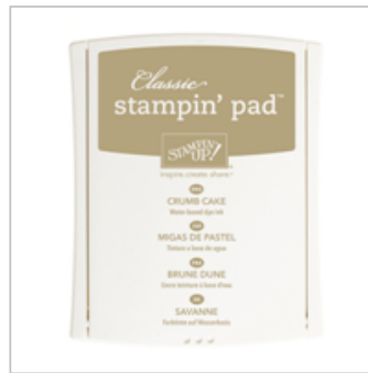
Crumb Cake Classic Stampin' Pad 126975