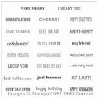
And Many More Clear-Mount Stamp Set 134276

http://www2.stampinup.com/ECWeb/default.aspx?email=stampinjanneke%40gmail.com&phone=06+30280297