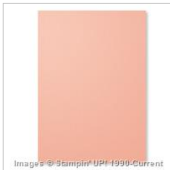
Card Stock A4 Crisp Cantaloupe 131303