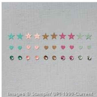
2013-2015 In Color Sequin Assortment