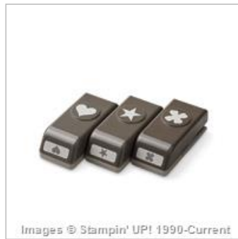
Itty Bitty Accents