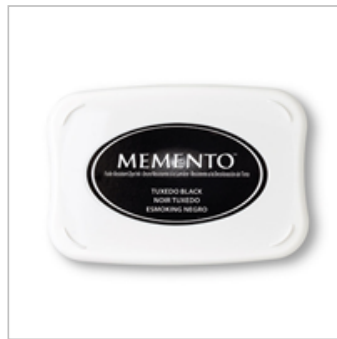
Tuxedo Black Memento Ink Pad 132708