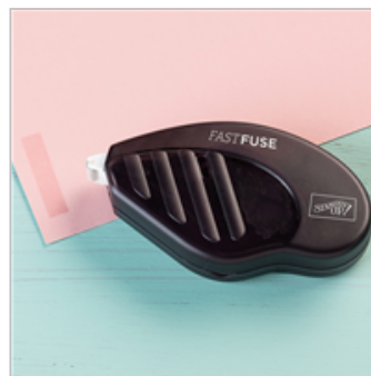
Fast Fuse Adhesive