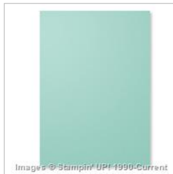
Card Stock A4 Coastal Cabana 131302