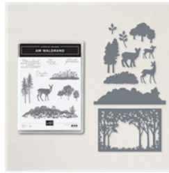
Produktpaket Am Waldrand (Deutsch) - 157847