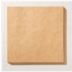
Kraftpapier 6" X 6" (15.2 X 15.2 Cm) Im Kombipack - 156325

Katja Bosniakowski 0157/37533378 katja@machsdirschoen.info www.machsdirschoen.info