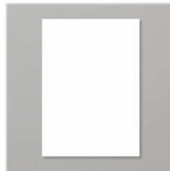
Farbkarton A4 Grundweiss - 159228