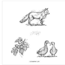
Stempelset Ablösbar Stylish Sketches - 159937