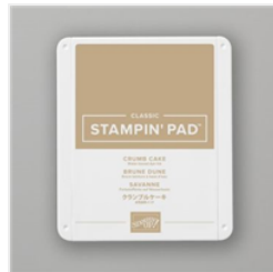
Klassisches Stempelkissen In Savanne - 147116