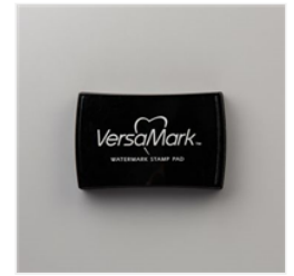
VersaMark Stempelkissen - 102283