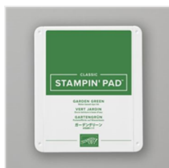
Klassisches Stempelkissen In Gartengrün - 147089