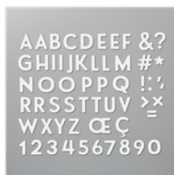
Stanzformen Buchstabenmix - 152706