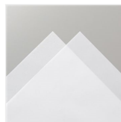
Farbkarton A4 Pergament - 106584