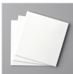
Doppelseitig Selbstklebende Schaumstoffbögen - 152815