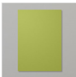
Farbkarton A4 Olivgrün - 106576