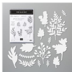
Produktpaket Für Alle Zeit (Deutsch) - 154096

Katja Bosniakowski 0157/37533378 katja@machsdirschoen.info www.machsdirschoen.info