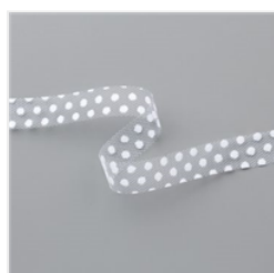
5/8" (1.6 Cm) Gepunktetes Tüllband In Flüsterweiss - 146912