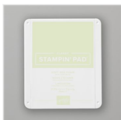
Klassisches Stempelkissen In Lindgrün - 147102