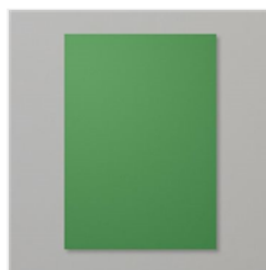
Farbkarton A4 Gartengrün - 108605