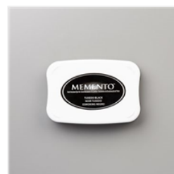
Tampon Encreur Memento Noir Tuxedo - 132708