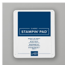
Tampon Encreur Classic Bleu Nuit - 147110