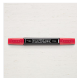
Real Red Dark Stampin' Blends - 147934