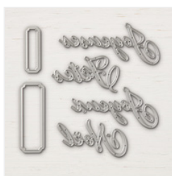
Joyeux Noël Dies (French) - 148024