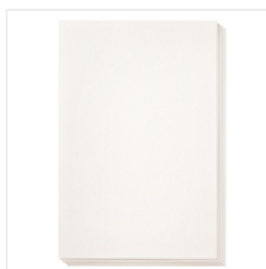
Watercolor Paper - 122959