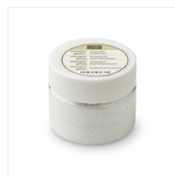
Dazzling Diamonds Stampin' Glitter - 133751