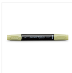
Old Olive Light Stampin' Blends Marker - 144574