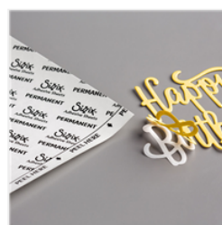
Multipurpose Adhesive Sheets - 144106