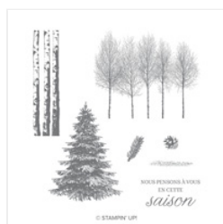
Bois Hiveraux Clear-Mount Stamp Set (French) - 148867