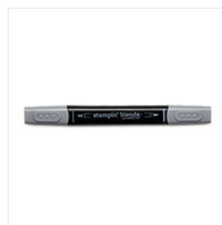
Smoky Slate Dark Stampin' Blends Marker - 145055