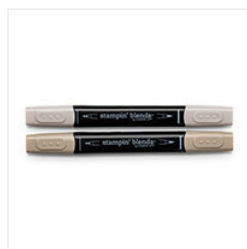
Crumb Cake Stampin' Blends Markers Combo Pack - 144601