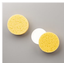
Éponges De Stamp' Art - 141337