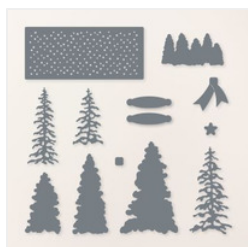
Peaceful Evergreens Dies - 164024