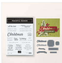
Peaceful Season Bundle (English) - 164021