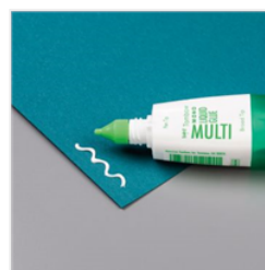
Multipurpose Liquid Glue - 110755