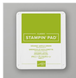
Granny Apple Green Classic Stampin' Pad - 147095