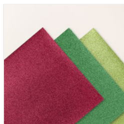
Festive 12" X 12" (30.5 X 30.5 Cm) Glimmer Paper - 164106