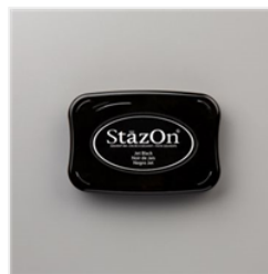
Jet Black Stazon Pad - 101406