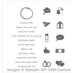
Iconic Occasions Clear-Mount Stamp Set - 143199