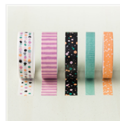
Playful Palette Designer Washi Tape - 141659