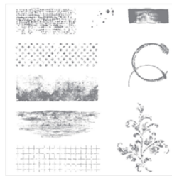
Timeless Textures Clear-Mount Stamp Set - 140517