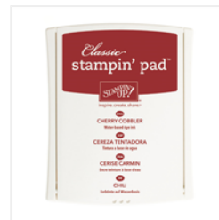
Cherry Cobbler Classic Stampin' Pad - 126966