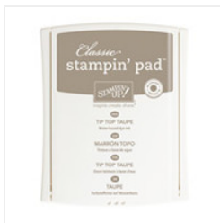
Tip Top Taupe Classic Stampin' Pad - 138325