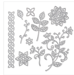
Flourish Dies - 141478