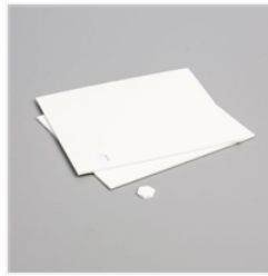
Stampin' Dimensionals - 104430