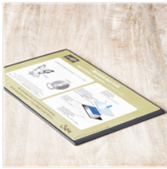
Precision Base Plate - 139684

astampingeddy@gmail.com http://stampingincolumbusga.blogspot.com/