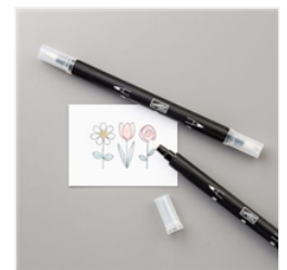
Blender Pens - 102845