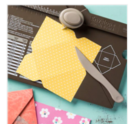
Envelope Punch Board - 133774