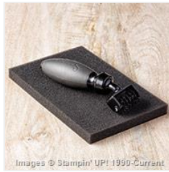
Big Shot Die Brush - 140603