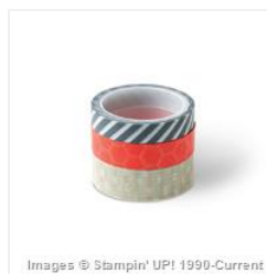
Epic Day Designer Washi Tape - 131269