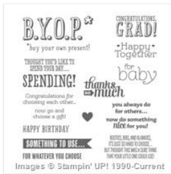
B.Y.O.P. Photopolymer Stamp Set - 137159

astampingteddy@gmail.com http://stampingincolumbusga.blogspot.com/