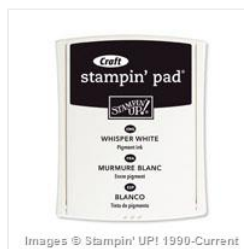
Whisper White Craft Stampin' Pad - 101731