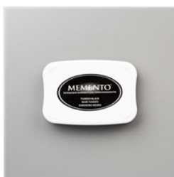
Tuxedo Black Memento Ink Pad - 132708