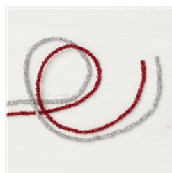
Mini Tinsel Trim Combo Pack - 144636