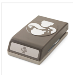
Fox Builder Punch - 141470