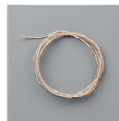
Linen Thread - 104199