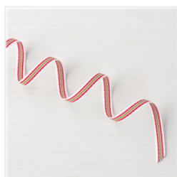
Quilted Christmas 1/4" (6.4 Mm) Ribbon - 144620