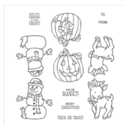
Seasonal Chums Wood-Mount Stamp Set - 144945