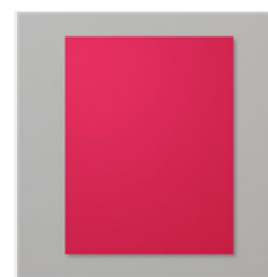
Real Red 8-1/2" X 11" Cardstock - 102482