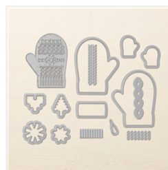
Many Mittens Framelits Dies - 144672