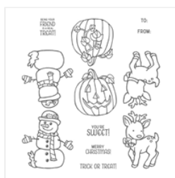
Seasonal Chums Clear-Mount Stamp Set - 144948