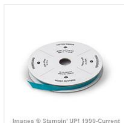
Island Indigo 1/4" Cotton Ribbon - 134557