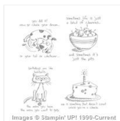
Giggle Greetings Wood-Mount Stamp Set - 131062