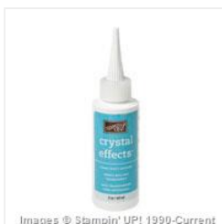
Crystal Effects - 101055