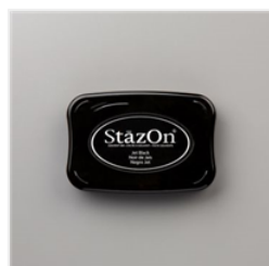
Jet Black Stazon Pad - 101406