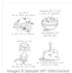
Giggle Greetings Clear-Mount Stamp Set - 131065

stampwithmarybush@yahoo.com www.stampinthesand.stampinup.net