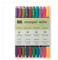
Regals Stampin' Write Markers - 131262