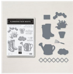
Lot Flowering Rain Boots - 157691