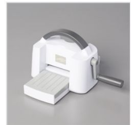
Mini-Machine De Découpe Et Gaufrage - 150673