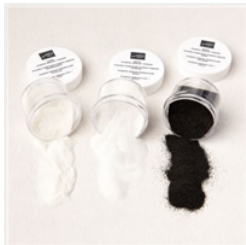
Poudres À Embosser Stampin' Emboss Essentielles - 155554