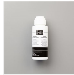
Nettoyant Stzon - 109196