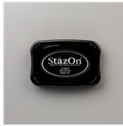
Tampon Encreur Stazon Noir Jais - 101406