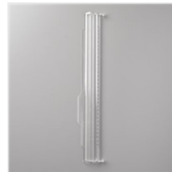
Règle Métrique Pour Coupe-Papier - 154980