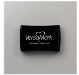
Tampon Encreur VersaMark - 102283