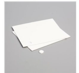
Stampin' Dimensionals - 104430