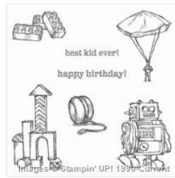
Boys Will Be Boys Clear-Mount Stamp Set - 134138