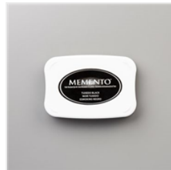
Tuxedo Black Memento Ink Pad - 132708