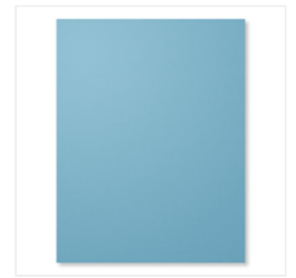
Marina Mist 8-1/2" X 11" Cardstock - 119682