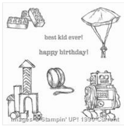
Boys Will Be Boys Wood-Mount Stamp Set - 134135