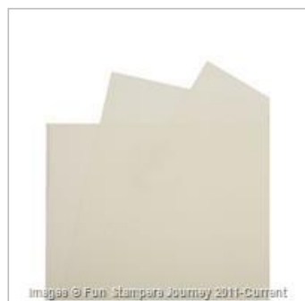
Clear View Sheets