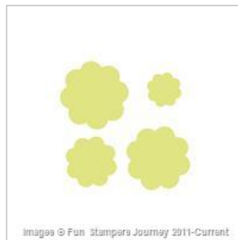
Summer Pretties Punch Cartridge