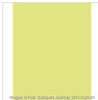
Sweet Pear 8.5x11