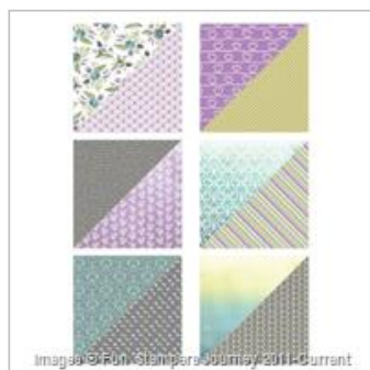
Summer Romance Printed Paper