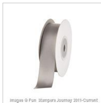
Satin Ribbon River Stone