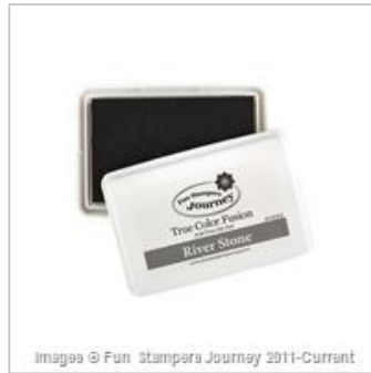
River Stone True Color Fusion Ink Pad