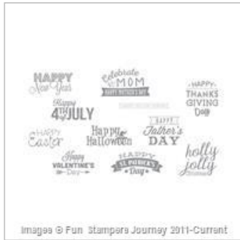
Annual Celebration Stamp Set