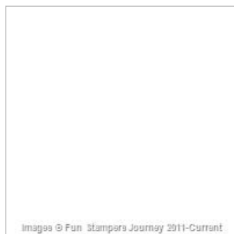
Whip Cream 8.5 x 11