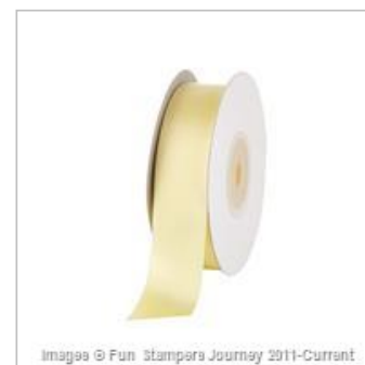
Satin Ribbon Sweet Pear