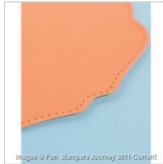
Treat Label Bundle