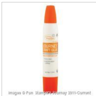
Journey Craft Glue