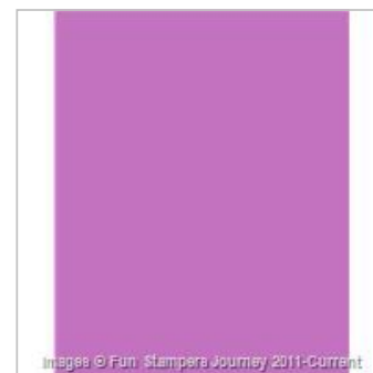
Lavender Fusion 8.5 x