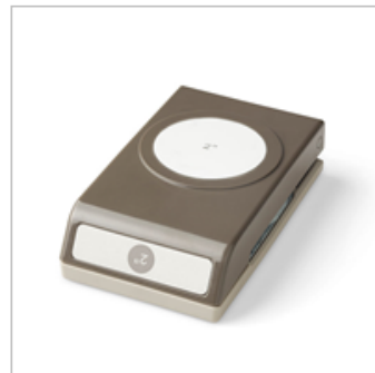
2" (5.1 Cm) Circle Punch