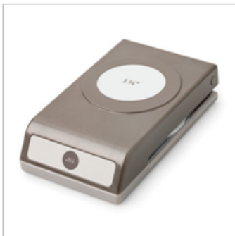
1-3/4" (4.4 Cm) Circle Punch