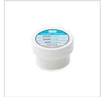
White Stampin' Emboss Powder