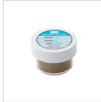
Gold Stampin' Emboss Powder