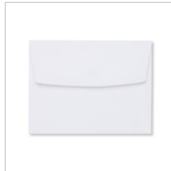
Whisper White Medium Envelopes