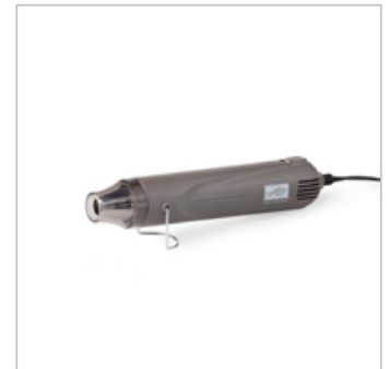
Heat Tool (Us And Canada)