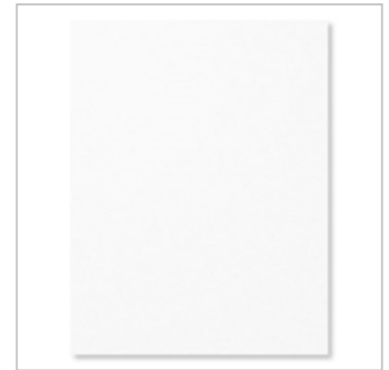
Whisper White 8-1/2" X 11" Cardstock