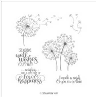
Dandelion Wishes Clear-Mount Stamp