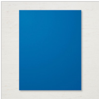
Blueberry Bushel 8-1/2" X 11" Cardstock