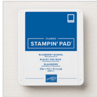
Blueberry Bushel Classic Stampin' Pad