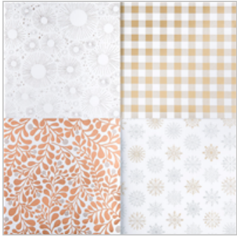
Year Of Cheer Specialty Designer Series Paper