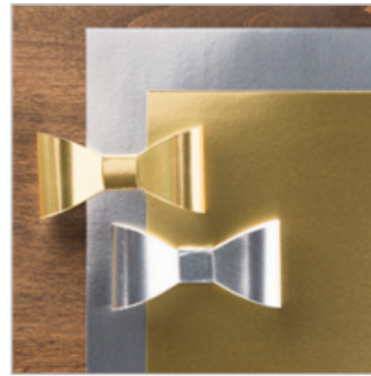
Silver Foil Sheets