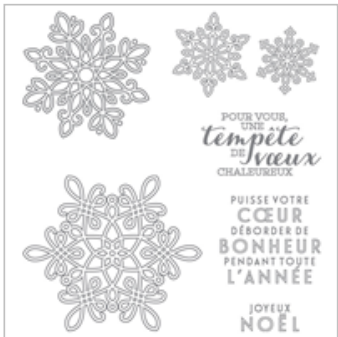
Tempête De Souhaits Photopolymer Stamp Set (French)