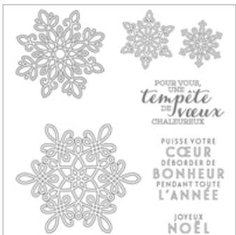
Tempête De Souhaits Photopolymer Stamp Set (French)