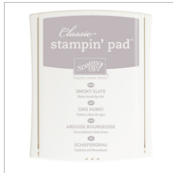
Smoky Slate Classic Stampin' Pad