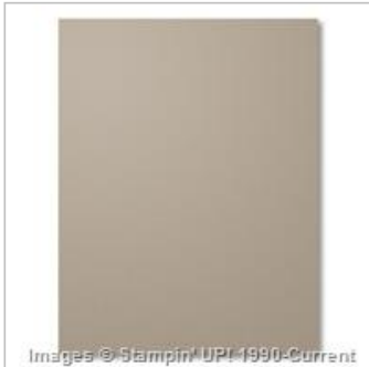
Tip Top Taupe 8-1/2" X 11" Cardstock