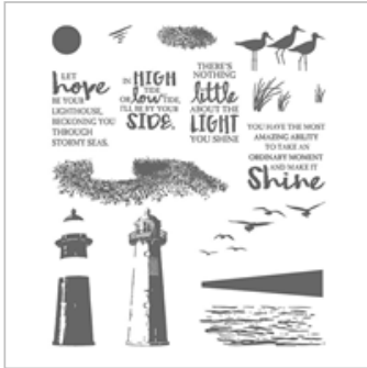
High Tide Photopolymer Stamp