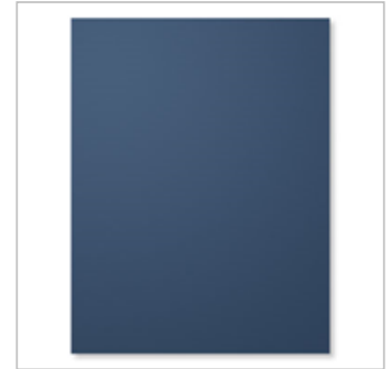
Night Of Navy 8-1/2" X 11" Cardstock