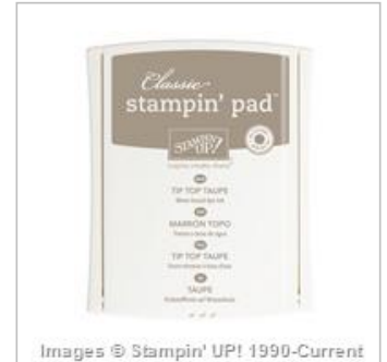
Tip Top Taupe Classic Stampin' Pad