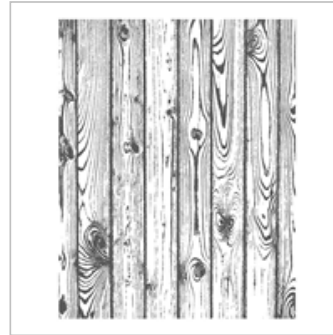
Hardwood Wood- Mount Stamp