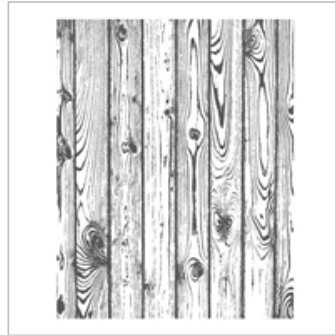
Hardwood Clear- Mount Stamp