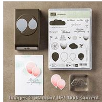
Partyballons Photopolymer Bundle