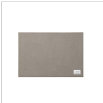
Stampin' Pierce Mat