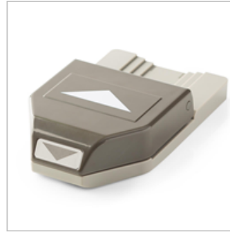
Banner Triple Punch