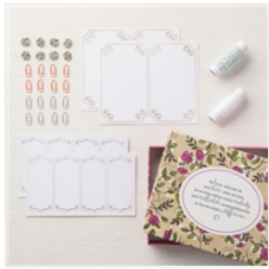
Lot D'ornements Partagez Ce Que Vous Aimez - 146928