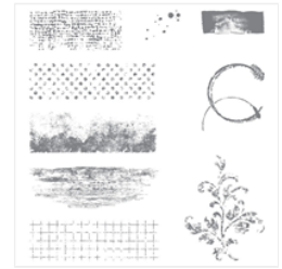
Timeless Textures Wood-Mount Stamp Set - 140514