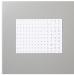
Bijoux Classiques Cristal Du Rhin - 144220