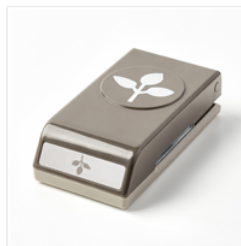
Leaf Punch - 144667