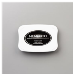
Encreur Memento Noir Tuxedo - 132708