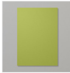
Papier Cartonné A4 Vert Olive - 106576