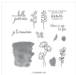
Aime Ce Que Tu Fais Photopolymer Stamp Set (French) - 148068