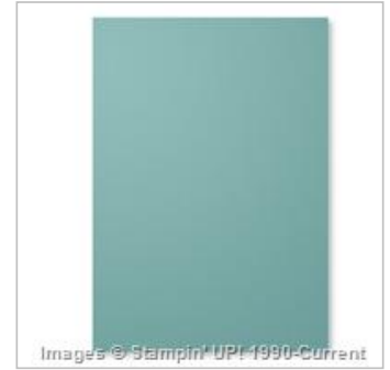
Lost Lagoon A4 Cardstock