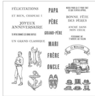
Vœux Pour Homme Photopolymer Stamp