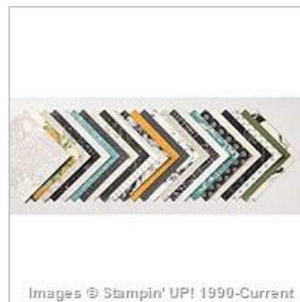
Going Places Designer Series Paper Stack