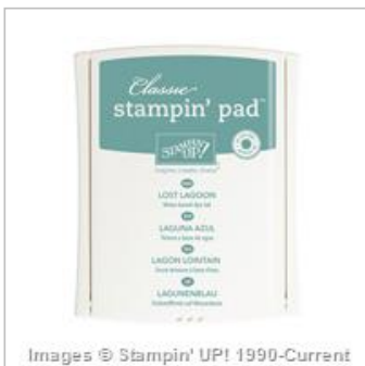
Lost Lagoon Classic Stampin' Pad