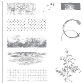
Timeless Textures Clear-Mount Stamp