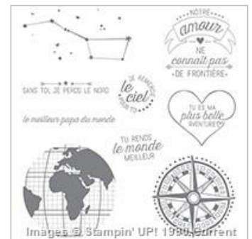
Jusqu'au Bout Du Monde Clear-Mount Stamp Set (French)