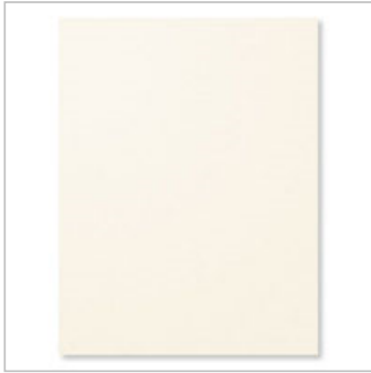
Very Vanilla A4 Cardstock