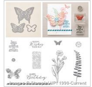
Butterfly Basics Photopolymer Bundle