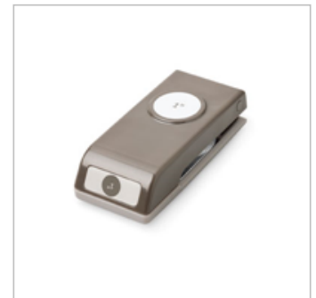
1\" (2.5 Cm) Circle Punch