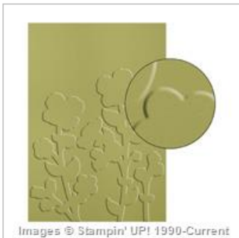
Wildflower Meadow Textured Impressions Embossing Folder