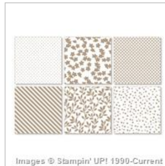
Irresistibly Yours Specialty Designer Series Paper