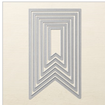
Banners Framelits Dies