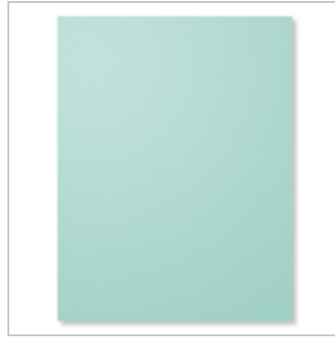
Pool Party 8-1/2\" X 11\" Cardstock