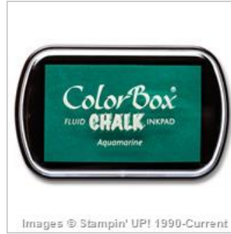
Aquamarine Colorbox Chalk Ink Pad