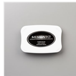
Tuxedo Black Memento Ink Pad - 132708