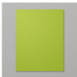
Granny Apple Green 8-1/2" X 11" Cardstock - 146990