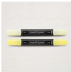
Pineapple Punch Stampin' Blends Markers Combo Pack - 147280