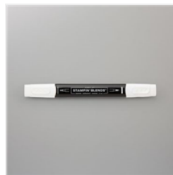
Stampin' Blends Color Lifter - 144608