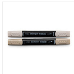
Crumb Cake Stampin' Blends Markers Combo Pack - 144601