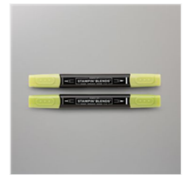
Granny Apple Green Stampin' Blends Combo Pack - 147274