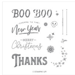
Warm Hearted Photopolymer Stamp Set - 147777