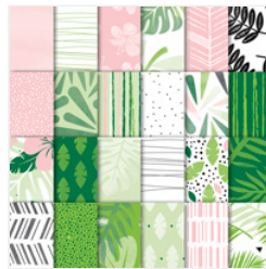
Tropical Escape 6" X 6" (15.2 X 15.2 Cm) Designer Series Paper - 146916