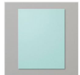
Pool Party 8-1/2" X 11" Cardstock - 122924