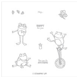
So Hopp Together Cling Stamp Set - 149725