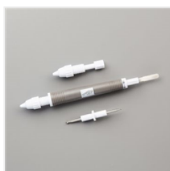
Outil Touche-À-Tout - 144107