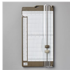
Coupe-Papier - 152392