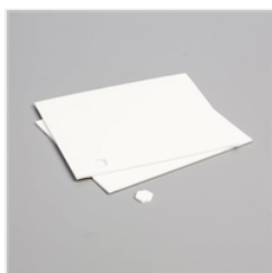
Stampin' Dimensionals - 104430