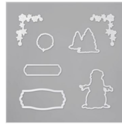
Poinçons Vive La Neige - 153564