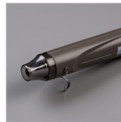
Pistolet Chauffant Prise Eu - 129055