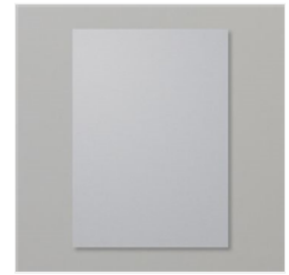
Papier Cartonné A4 Ardoise Bourgeoise - 131291