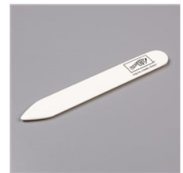
Plioir En Os - 102300