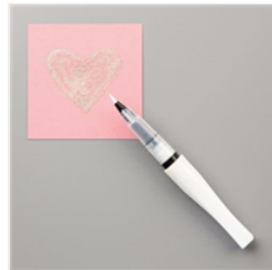
Pinceau Wink Of Stella Transparent - 141897