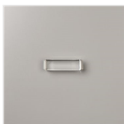
Bloc Transparent G - 118489