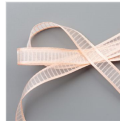
Ruban D'Organdi Rayé 5/8" (1.6 Cm) Pétale Rose - 149441