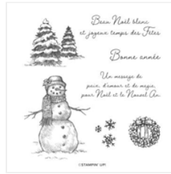
Set Blanc De Tampons Sous Un Manteau Blanc - 153835