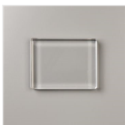
Bloc Transparent E - 118484