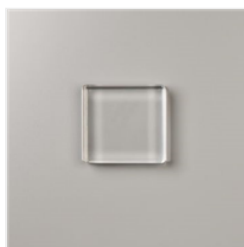
Bloc Transparent D - 118485