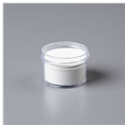
Poudre Stampin' Emboss Blanc - 109132