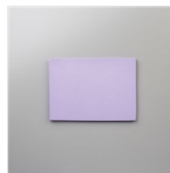
Chamois Synthétique - 147042