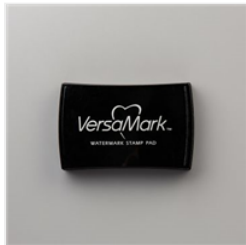
Tampon Encreur Versamark - 102283