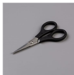
Ciseaux À Papier - 103579