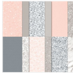
Papier De La Série Design Jardin De Pivoines - 152483