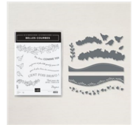
Lot Belles Courbes - 156229