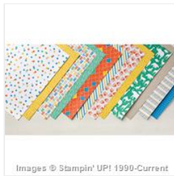
Party Animal Designer Series Paper - 147365