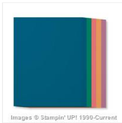
2016-2018 In Color 8-1/2" X 11" Cardstock - 147361