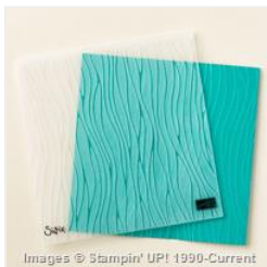
Seaside Textured Impressions Embossing Folder - 147360