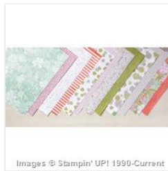
Succulent Garden Designer Series Paper - 147363