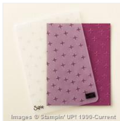
Sparkle Textured Impressions Embossing Folder - 147356