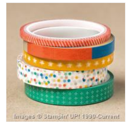
Party Animal Designer Washi Tape - 147362