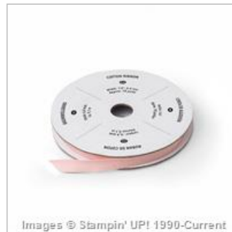
Blushing Bride 1/4" Cotton Ribbon