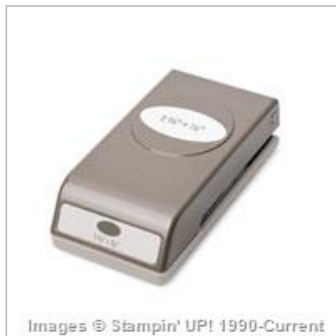
Large Oval Punch