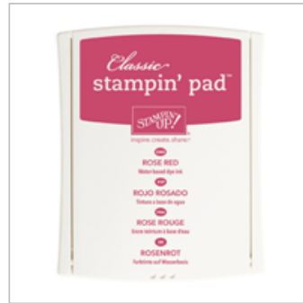
Rose Red Classic Stampin' Pad