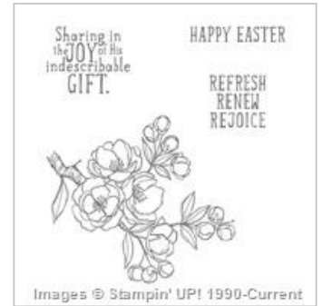
Indescribable Gift Clear Stamp Set