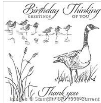
Wetlands Clear- Mount Stamp Set