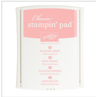
Blushing Bride Classic Stampin' Pad