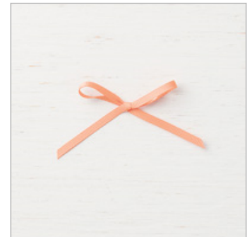
Grapefruit Grove 1/8" (3.2 Mm) Grosgrain Ribbon