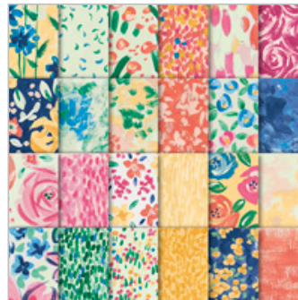
Garden Impressions 6" X 6" (15.2 X 15.2 Cm) Designer Series Paper