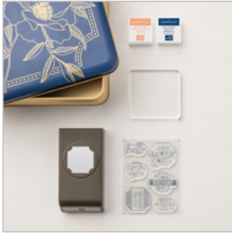
Darling Label Punch Box