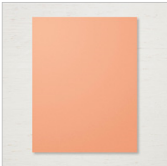
Grapefruit Grove 8-1/2" X 11" Cardstock