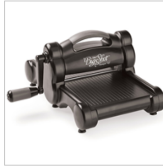
Big Shot 143263 $110.00