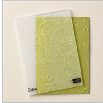
Layered Leaves Dynamic Textured Impressions Embossing Folder