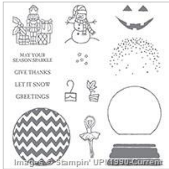
Sparkly Seasons Photopolymer Stamp