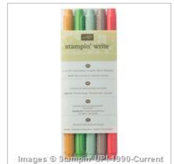
2015-2017 In Color Stampin' Write Markers