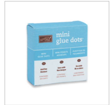
Mini Glue Dots