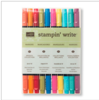
Brights Stampin' Write