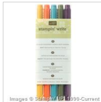
2014-2016 In Color Stampin' Write Markers