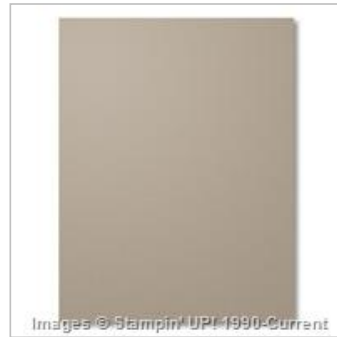
Tip Top Taupe 8-1/2" X 11" Cardstock