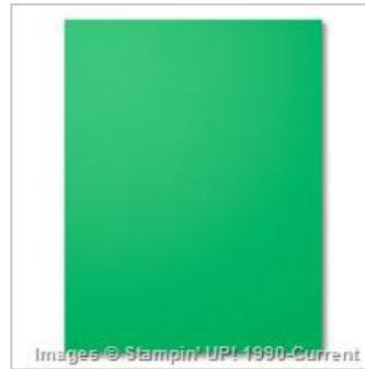
Cucumber Crush 8-1/2" X 11" Cardstock