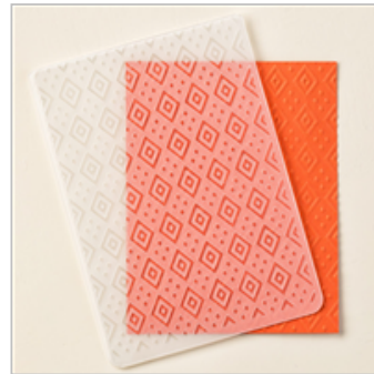
Boho Chic Textured