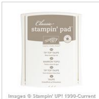
Tip Top Taupe Classic Stampin' Pad