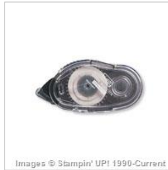
Snail Adhesive 104332