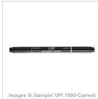
Basic Black Stampin' Write Marker 100082