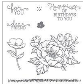
Birthday Blooms Clear-Mount Stamp Set