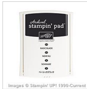
Basic Black Archival Stampin' Pad