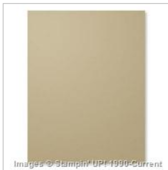
Crumb Cake 8-1/2" 11" Cardstock