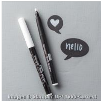
White Stampin' Chalk Marker 132133

Tami White tami@stampwithtami.com www.stampwithtami.com