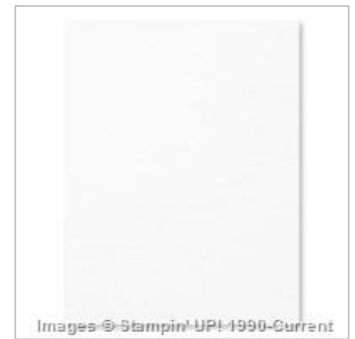
Whisper White 8-1/2" X 11" Cardstock