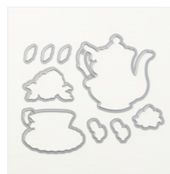
Tea Time Dies - 149697