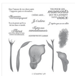
Calla Éternelle Photopolymer Stamp Set - 149995