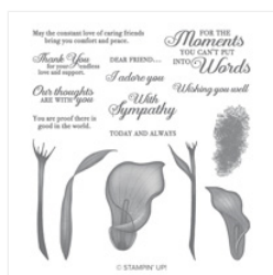
Lasting Lily Photopolymer Stamp Set - 149717